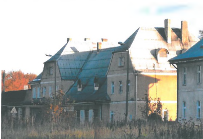
Zdjęcie nr 12. Zespół stacji kolejowej, ul. Kolejowa, Biała Piska

Z tej grupy obiektów zachowały się zabytki kolejnictwa (torowiska i zespoły dworów), drogownictwa (drogi w zdecydowanej większości są o proveniencji późnośredniowiecznej). Zespoły dworców znajdują się w miejscowościach - Biała Piska, Drygały, Kaliszki, Pogorzelska Wielka. Są to zespoły obiektów, głównie obecnie pełniących funkcję mieszkalną, których stan zachowania jest niezadawalający.