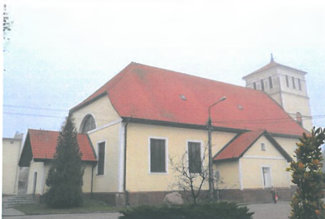
Zdjęcie nr 1. Kościół parafialny pw. św. Andrzeja Baboli z wieżą, ul. Plac Mickiewicza 22, Biała Piska

Kościół ewangelicki pw. Matki Boskiej i św. Józefa, ob. parafialny pw. św. Andrzeja Baboli z wieżą, wyposażeniem wnętrza szczególnie płytą nagrobną Bernarda Drygalskiego, ul. Plac Mickiewicza 22, Biała Piska