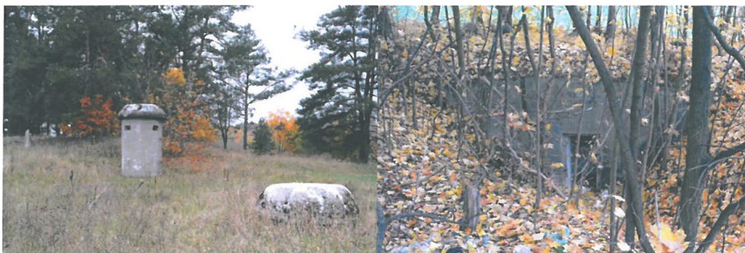
Zdjęcia nr 13, 14. Schrony, Świdry

Na terenie gminy zachowały się obiekty militarne z czasów I wojny światowej. Można odnaleźć liczne pozostałości tzw. garnków Kocha z II wojny światowej, zwany również Kochbunkier - mały schron jednoosobowy. Niezwykle popularny niemiecki schron, jako jedyny był produkowany masowo w fabrykach jako prefabrykat - i jako taki był przywożony gotowy na miejsce posadowienia. Jego rolę na polu bitwy można określić krótko - lepsze to niż zwykły okop, dawał podstawowe schronienie przed ogniem wroga. Kochbunkier nie chronił strzelca przed bezpośrednim uderzeniem pocisku większego kalibru, ale spokojnie opierał się odłamkom. Część Mazurskiej Pozycji Granicznej (Masurische Grenz Stellung) zbudowanej w okolicy wsi Świdry w latach 1939 - 1941. Punkt składa się z obiektów klasy Bneu: R113d, 3 R115c oraz słabszych schronów: 2 garaży dla ppanc, schronu dla