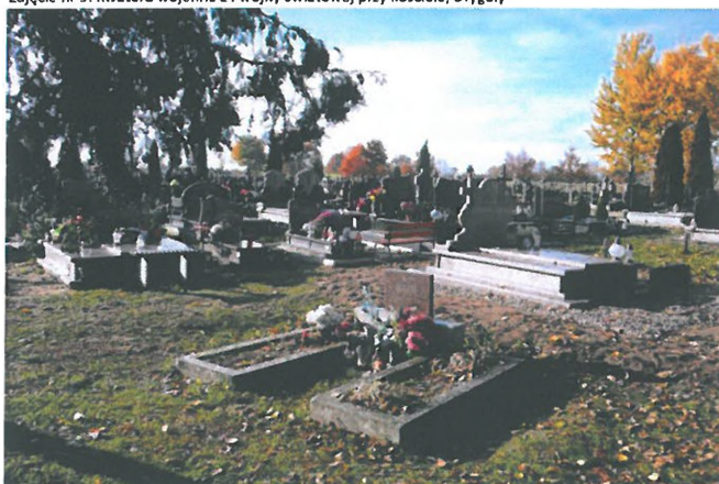
Zdjęcie nr 10. Cmentarz parafialny, Drygały

Na terenie wschodnich Mazur zlokalizowane są licznie cmentarze z czasów I wojny światowej. Jesienią 1914 r. wojska niemieckie i rosyjskie starły się w wielkiej bitwie nad jeziorami mazurskimi. Strona atakująca byli Niemcy, którzy chcieli zatrzymać Rosjan a potem wyprzeć ich z Prus Wschodnich. W trakcie trwających dwa tygodnie walk zginęło po obu stronach kilkadziesiąt tysięcy żołnierzy. Na terenie gminy Biała Piska znajdują się cmentarze i mogiły: 50 cmentarzy wyznaniowych, dawnych ewangelickich. Stan zachowania cmentarzy jest niezadawalający, większość z nich zatraciła pierwotny układ, są zarośnięte, zaniedbane, nieogrodzone. Trudno do nich trafić, gdyż nie są oznakowane. Obiekty te reprezentują duże