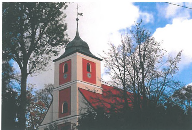
Zdjęcie nr 2. Kościół rzymskokatolicki, parafialny pw. Matki Boskiej Częstochowskiej, ul. Sienkiewicza 3a, Drygały

Pierwszy kościół katolicki zbudowano w 1438 r. Spalony w czasie Potopu w 1656 r. przez Tatarów. Kościół odbudowany przez katolików w 1660 r., rozebrano w 1730 r. W latach 1731 - 1732 zbudowano istniejący kościół.