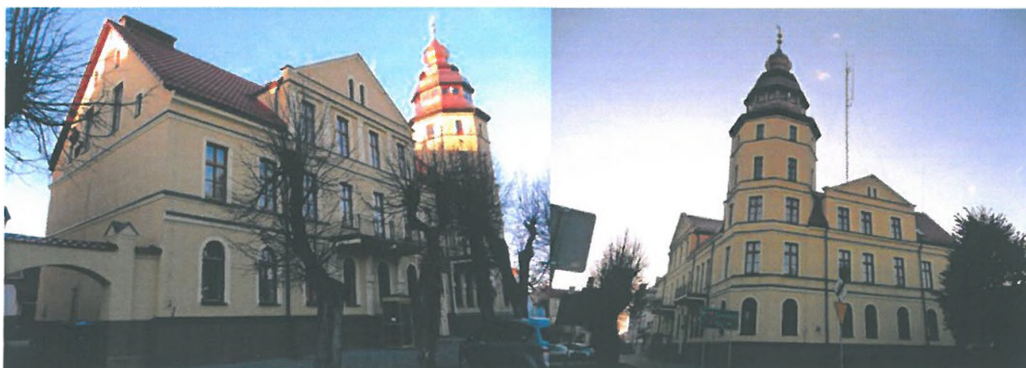
Zdjęcie 6, 7. Ratusz, ul. Plac Mickiewicza 25 w Białej Piskiej