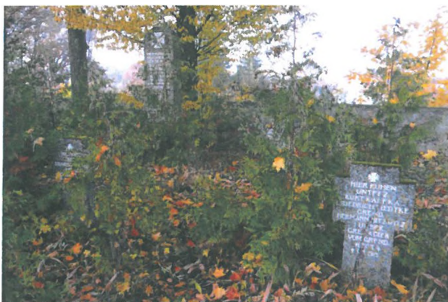
Zdjęcie nr 9. Kwatera wojenna z I wojny światowej przy kościele, Drygały