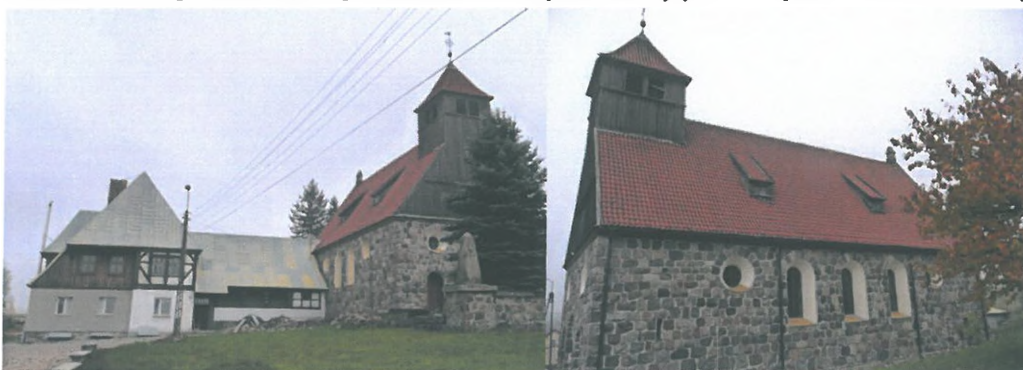
Zdjęcie 4, 5. Kościół rzymskokatolicki, parafialny pw. Chrystusa Króla, Skarżyn

Kościół wzniesiony w latach 1927 - 1929, na miejscu poprzedniego, drewnianego. Po II wojnie światowej przejęty przez katolików. Zespół kościelny usytuowany w centrum wsi, po pñ. stronie drogi. Zespół usytuowany jest na obszernej parceli, na wzniesieniu. Kościół połączony łącznikiem z plebanią.