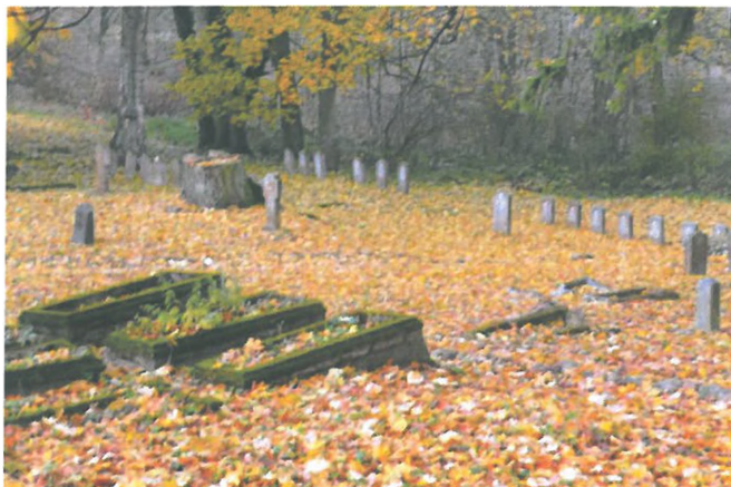
Zdjęcie nr 8. Cmentarz ewangelicki, ul. Sikorskiego, Biała Piska