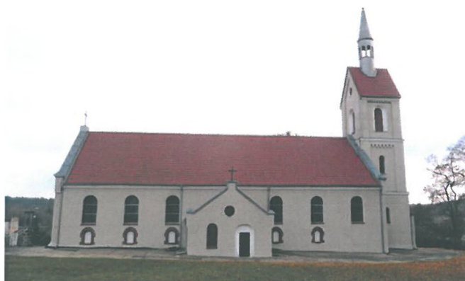
Zdjęcie nr 3. Kościół parafialny pw. Narodzenia NMP, Kumielsk

Przy kościele groby wojenne z okresu I wojny światowej oraz cmentarz przykościelny.