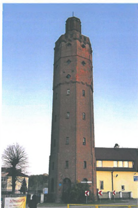
Zdjęcie nr 11. Wieża ciśnień, ul. Ogrodowa 1, Biała Piska

W Białej Piskiej znajdował się także cmentarz żydowski, usytuowany był w parku miejskim, w jego płd. - wsch. części, obecnie przy rozwidleniu ul. Parkowej i drogi wylotowej do Drygał. Nekropolię założono prawdopodobnie w 1862 r. W roku budżetowym 1863 - 1864 na dzierżawę i naprawę cmentarza (być może ogrodzenia) z kasy gminy synagogałnej wyasygnowano 5 talarów. Ostatnich pochówków dokonano zapewne pod koniec XIX w., wraz z upadkiem tutejszej gminy wyznaniowej.